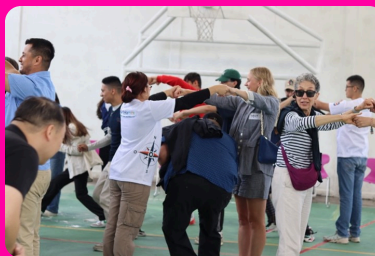
Visita a Prepa Jóvenes con Rumbo (JcR) y Proyecto Capacitación Integral para Mujeres en Acción (CIMA) en Centro Laboral México (CELAMEX) – YouthBuild México y Trust for the Americas