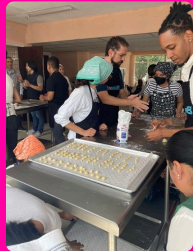
Programa JuventudES “Más que Pan” - Centro Juvenil Promoción Integral (CEJUV) y International Youth Foundation (IYF)