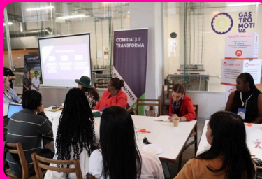
Formación Integral para el Trabajo (FIT) – Gastromotiva y World Vision México

En el marco de la conferencia, se visitaron distintos proyectos de instancias aliadas del Colaborativo GOYN para dar a conocer el trabajo de impacto colectivo que se realiza en la Ciudad de México en favor de las y los jóvenes oportunidad .